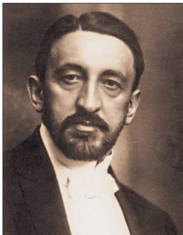
Ryc. 4. Józef Brudziński Fig. 4. Józef Brudziński