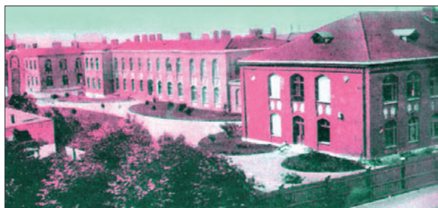
Ryc. 2. Szpital Anny Marii dla dzieci w Łodzi Fig. 2. Anna-Maria Hospital for children in Łódź