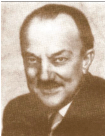
Ryc. 5. Władysław Szenajch Fig. 5. Władysław Szenajch