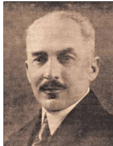
Ryc. 6. Tadeusz Mogilnicki Fig. 6. Tadeusz Mogilnicki

szego na ziemiach polskich czasopisma poświęconego chorym dzieciom – „Przeglądu Pedyatrycznego”. Józef Brudziński ogłosił drukiem 59 prac naukowych, za najważniejsze należy uznać: „O występowaniu bacillus proteus vulgaris w stolcach niemowląt”, „O próbie leczenia biegunek stosowaniem bacillus lactis aerogenes ” oraz „Znaczenie objawu karkowo-nerwowego w zapaleniu opon mózgowo-rdzeniowych” (objaw Brudzińskiego) (10, 11). Ocena działalności leczniczej, naukowej i organizacyjnej upoważnia do uznania Józefa Brudzińskiego za wybitnego lekarza naszych dziejów. W 1910 r. opuścił Łódź, gdyż został powołany do nowo budowanego Szpitala im. Karola i Marii w Warszawie (fundacja Szlenkierów). Należy zaznaczyć, że Józef Brudziński był jednym z głównych organizatorów Polskiego Uniwersytetu w Warszawie i jego pierwszym rektorem (w 1915 r.).