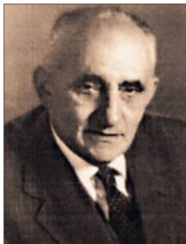
Ryc. 8. Franciszek Redlich Fig. 8. Franciszek Redlich